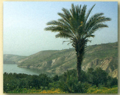
Kanaan: das von Gott versprochene (= »gelobte«) Land (siehe Karte S. 284 und 285).

Da beklagte sich das Volk wieder bei Mose. Kaleb, einer der Kundschafter, versuchte, die Leute zu beruhigen und sagte: »Lasst uns in das Land ziehen. Wir können die Einwohner besiegen.«