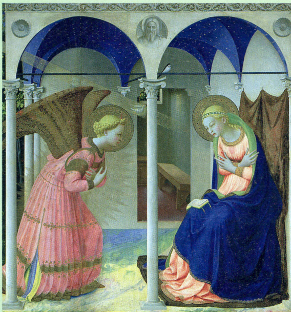
Fra Angelico, Die Verkündigung an Maria, 1455

Bei Matthäus kommt Jesus in einem Haus zur Welt. Lukas dagegen erzählt, dass Jesus in einer Herberge bei den Tieren geboren worden ist. Unter »Herberge« verstand man im Orient einen Ort, wo Reisende mit ihren Karawanen übernachten konnten (siehe Foto S. 203).