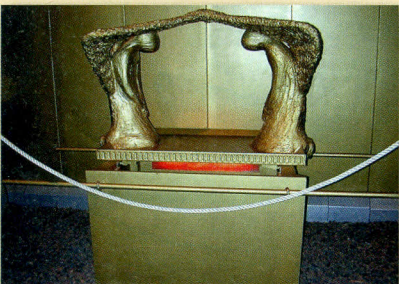
Modell der Bundeslade (siehe auch S. 85)

Nachkommen Aarons: Aaron gilt als der erste Hohepriester. Von ihm stammt die gesamte jüdische Priesterschaft ab.