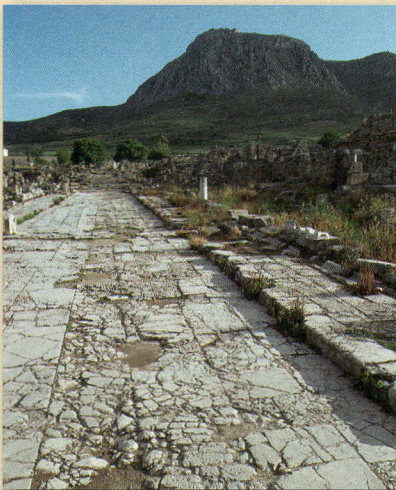
Überreste einer Straße im antiken Korinth

Gaben des Geistes: besondere Fähigkeiten, die Gott durch seinen Geist einzelnen Menschen gibt. Sie sind allesamt wichtig für den Aufbau und das Funktionieren der christlichen Gemeinde (zu Gottes Geist siehe auch S. 224).