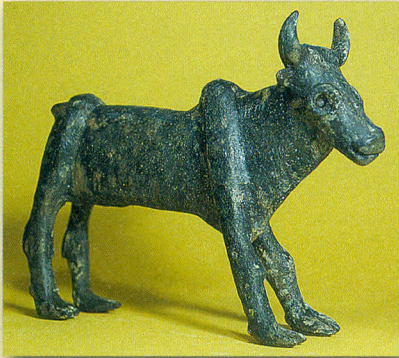
17 cm lange Stierfigur aus Bronze aus dem 12. Jahrhundert v. Chr. In dieser Größe kann man sich auch das »Goldene Kalb« vorstellen.

Kalb: Der Jungstier ist ein Symbol für Kraft und Stärke. Bei vielen Völkern in der Umgebung Israels verehrte man damals Stiergötter. In Ägypten stand der Stiergott Apis für Fruchtbarkeit. Die Bibel gebraucht mit dem Begriff »Kalb« bewusst ein abwertendes Wort für das Bild des Stiergottes, das Aaron anfertigte.