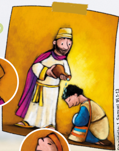
Bibelstelle: 1. Samuel 16,1-13

Die sieben Brüder von David berichten, was sie erlebt haben: