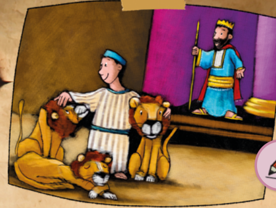
Bibelstelle: Daniel 6,2-29

In dem Bibeltext fehlen einige Wörter. Finde heraus, welches Wort wo passt: lebe, Löwengrube, vertrauen, Gesetz, bittet, neidisch, Löwen, schlafen