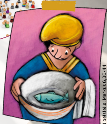
Bibelstelle: Markus 6,30-44

Jesus war mit seinen Jüngern in Galiläa unterwegs. Er erzählte den Menschen vom Reich Gottes. Die Leute hörten ihm zu, weil seine Lehre neu war und er Kranke heilte. So kam es, dass eine große Menschenmasse Jesus und seinen Jüngern folgte. Am Abend forderten die Jünger Jesus auf, die über 5000 Menschen nach Hause zu schicken, damit sie sich etwas zu essen kaufen könnten. Aber Jesus sagte zu ihnen: „Gebt ihr ihnen zu essen!“ Die Jünger waren entsetzt, denn sie hatten nur fünf Brote und zwei Fische. Das konnte unmöglich für alle reichen.